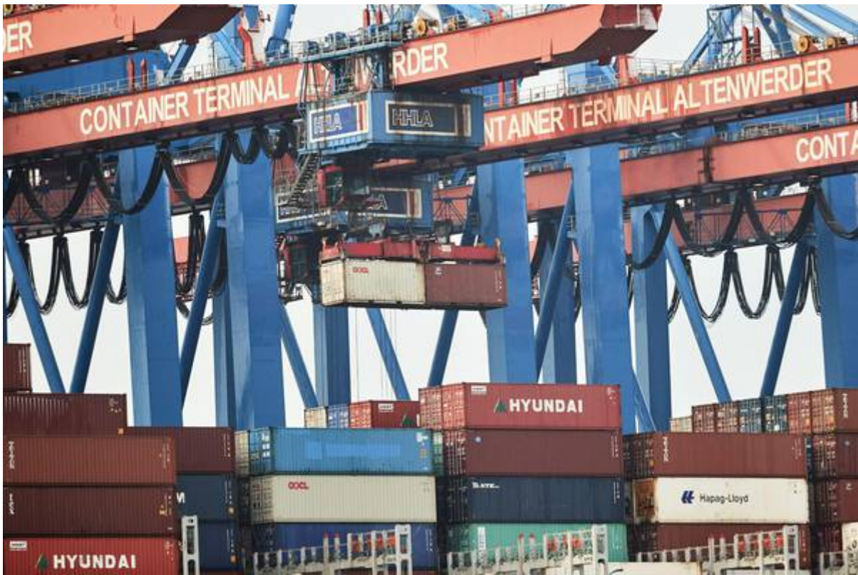
Porti: riforma Delrio ok, ora creare Ministero 'ad hoc'